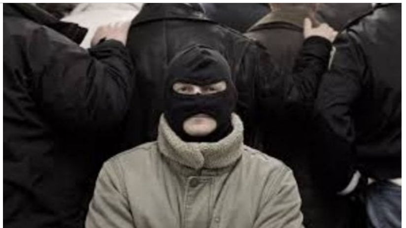
Il Capitano Ultimo

Al colonnello De Caprio, il carabiniere noto per aver arrestato Totò Riina nel 1993, era stata revocata la scorta lo scorso anno. "Grazie a chi ritiene la mafia ancora un pericolo"